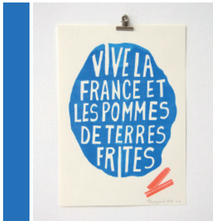
© Fotokino. Tous droits réservés. Imprimé avec un duplicopieur MZ de RISO.