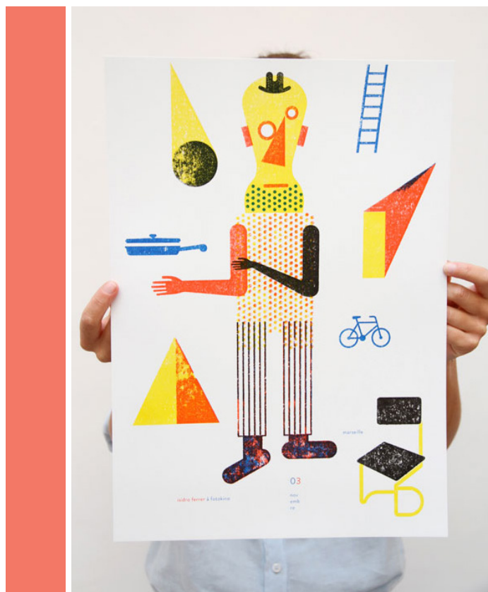
Imprimé avec un duplicopieur MZ de RISO.

Au-delà de l'usage quotidien de pouvoir imprimer de manière très spontanée les choses, nous produisons sur le matériel RISO des documents de communication, de petits flyers, des affichettes, etc., en particulier à l'attention du public qui vient dans notre lieu d'exposition (documents des visites, plans d'expositions, etc.). Nous avons également initié une collection d'images et d'ouvrages d'artistes avec lesquels nous collaborons. Ces tirages sont édités en un assez faible nombre d'exemplaires. Ce sont des images que nous produisons en une, deux, trois, quatre couleur(s) et qui nous permettent d'être dans un rapport à l'image avec des couleurs singulières. Cela se rapproche de la sérigraphie en termes de qualité (pour la reproduction du dessin, les aplats, etc.).