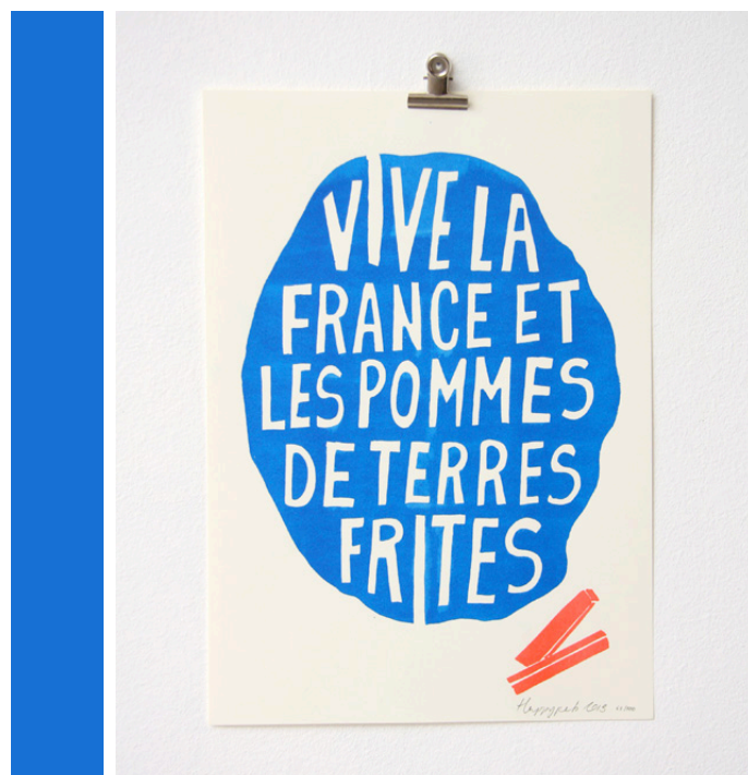
© Fotokino. Tous droits réservés. Imprimé avec un duplicopieur MZ de RISO.