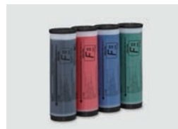
ENCRE RISO Couleur Type FIL (1000ml)