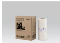
MASTER RISO Type FIL (B4 : 250 feuilles)

Le symbole RISO i Quality garantit la compatibilité avec RISO i Quality System.