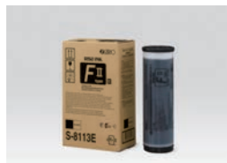
ENCRE RISO Type FIL noire (1000ml)